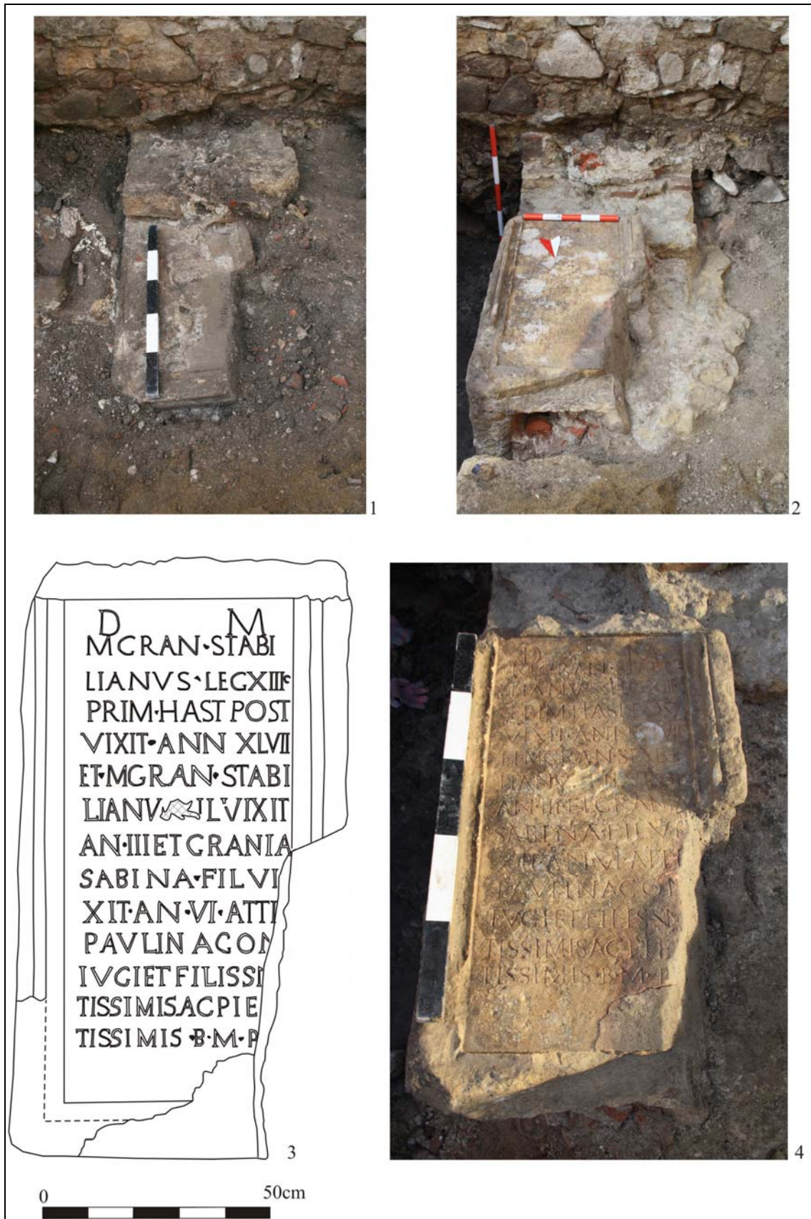
Pl. 2. 1–2. Inscriptie funerară, contextual descoperirii; 3–4. Detalii cu textul monumentului funerar.